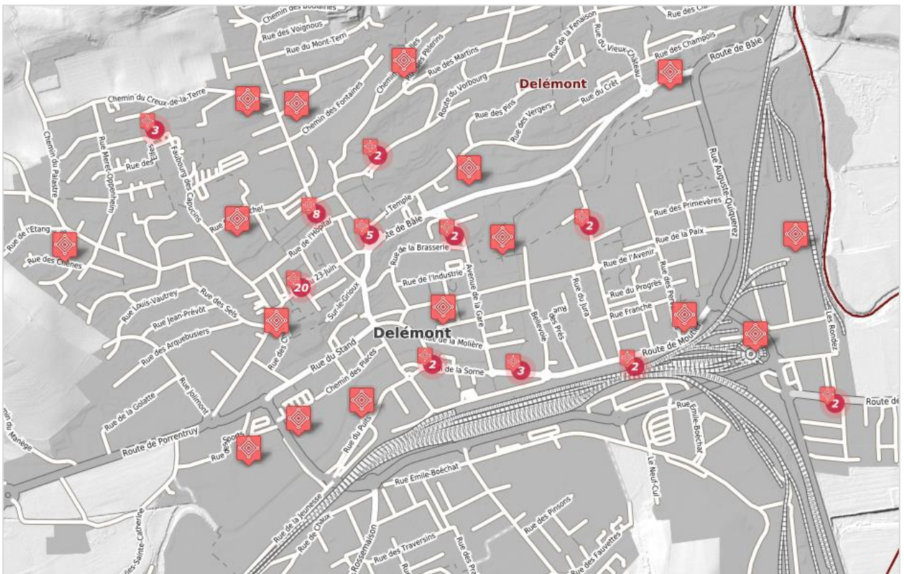
Illustration de la représentation des données « Répertoire des biens culturels (RBC) » - Géoportail du SIT-Jura

Il s'agit de la représentation officielle de la donnée et est utilisée dans le Géoportail.