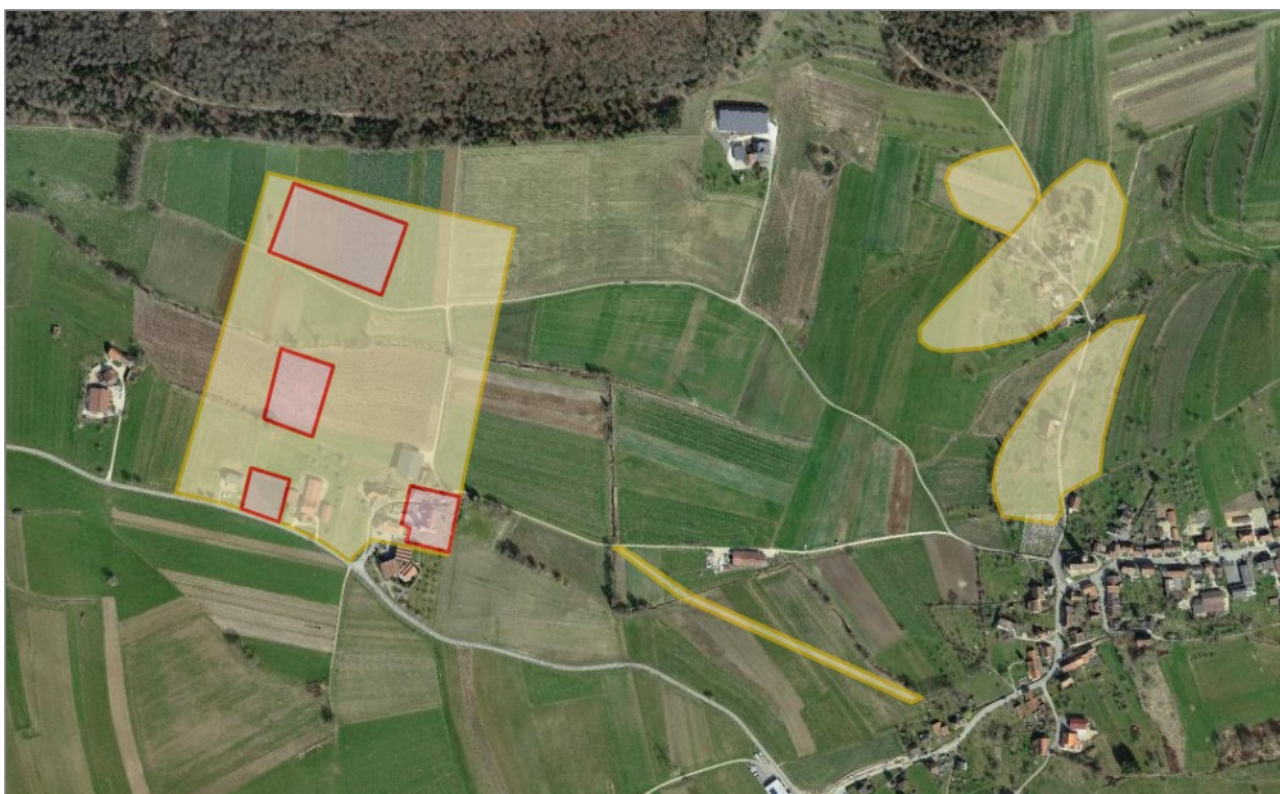
Illustration de la représentation des données « Inventaire des Sites archéologiques et paléontologiques » - Géoportail du SIT-Jura

Il s'agit de la représentation officielle de la donnée et est utilisée dans le Géoportail.