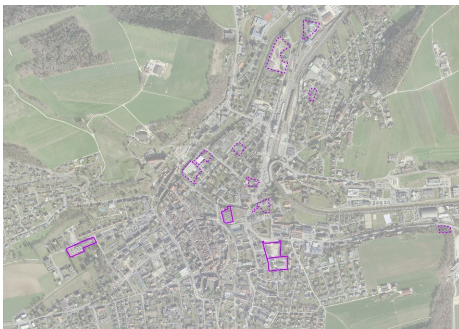
Figure 2: extrait de la couche Inventaire des friches urbaines et industrielles (ArcGis)

(Zoom sur une partie de la géodonnée sur le géoportail (essayer de voir toutes les valeurs - Si pas sur geoportail – Faire un exemple sur Arcgis,...)