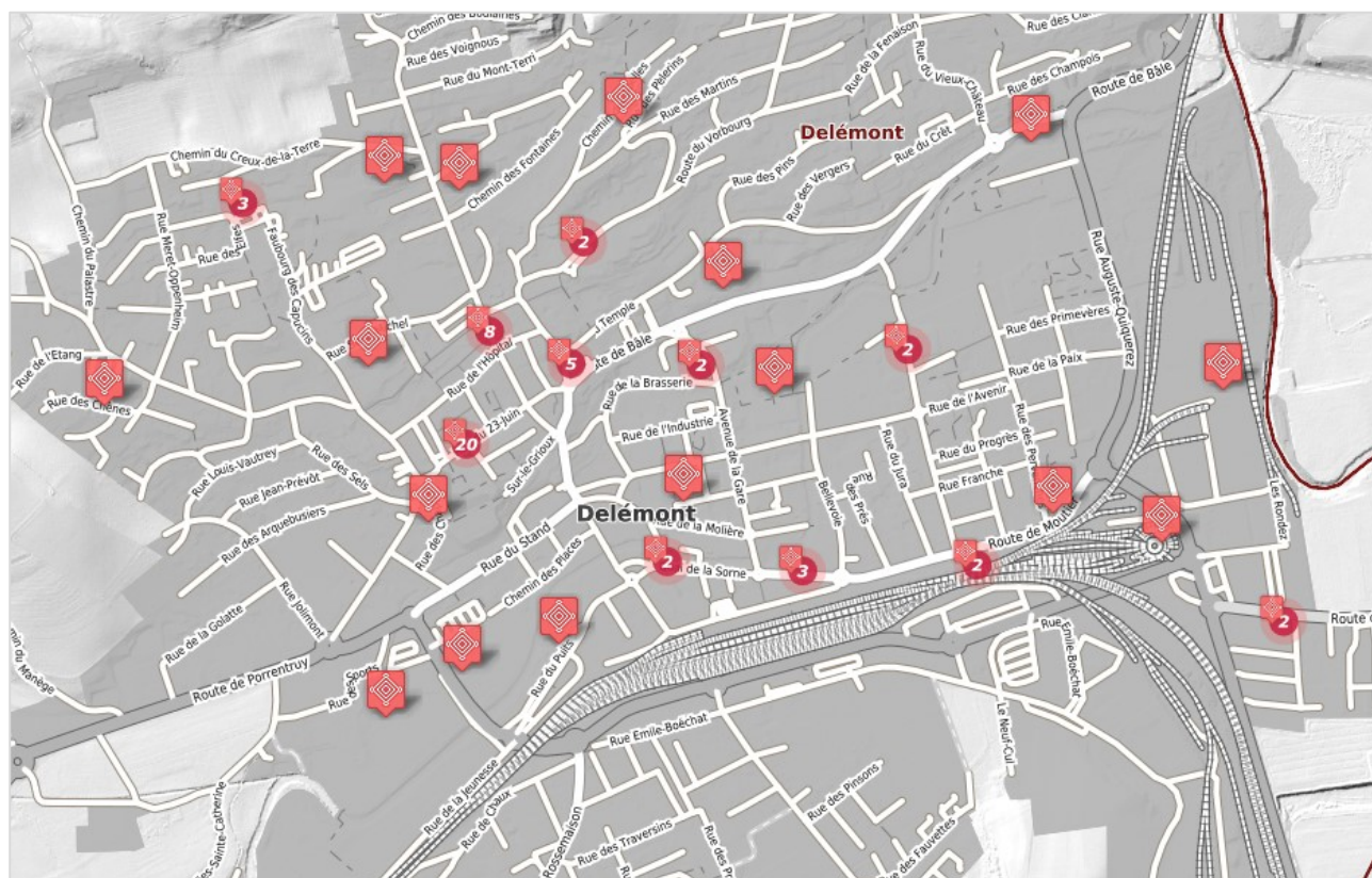
Illustration de la représentation des données « Répertoire des biens culturels (RBC) » - Géoportail du SIT-Jura

Il s'agit de la représentation officielle de la donnée et est utilisée dans le Géoportail.